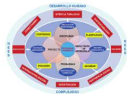
Figura 1. Esquema Integrado del Modelo Educativo

Este modelo orienta la implementación y ejecución del PEDI 2021-2025, en todas sus políticas, programas y proyectos enfocados a la formación de profesionales con calidad humana en la solución de problemas de la sociedad. La figura 1, esquematiza los componentes del Modelo Educativo.